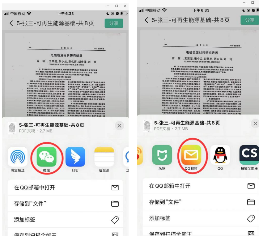
第 11 步

12、第 12 步，也可以通过 邮箱 直接发给监考老师，以 QQ 邮箱为例，选择“添加到新邮件”，在弹出的新页面收件人位置，填写制定的邮箱，主题以“组好-姓名-复试科目-共几页”命名。